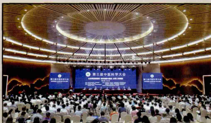
第三届中医科学大会会议现场图