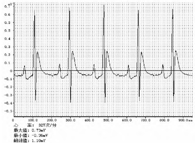
图1 正常大鼠心电图

型电极,并连接于BL-420F生物机能实验系统,显示II导联心电图(见图1),心电稳定后,舌下静脉注射乌头碱(20 μg/kg),5 s内注射完,立即观察II导联心电图变化,记录大鼠室早(见图2)的出现及终止时间,计算大鼠室早潜伏时间和持续时间。